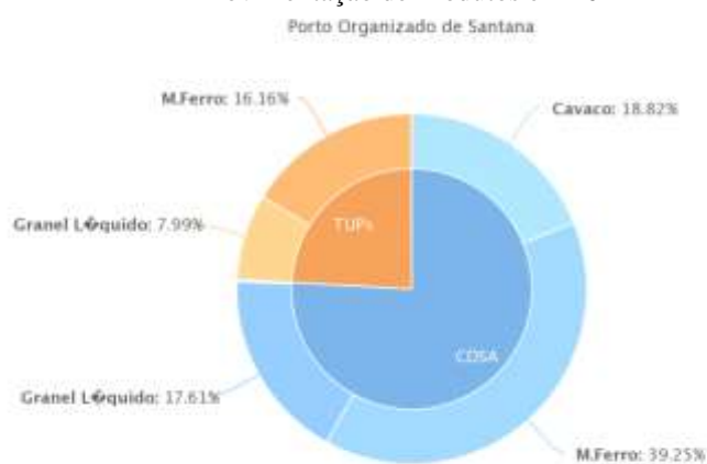
Tabela da Mov. de Cargas